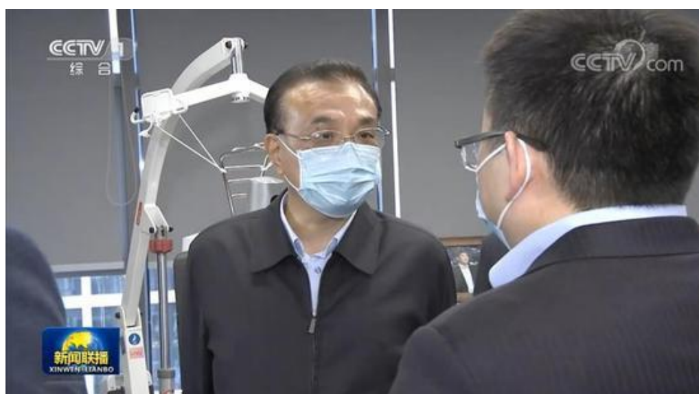
李清都向李克强总理汇报团队成果

此次我校科研团队能在“中原”亮相，受到李克强总理的关注，离不开我校与中原动力前期合作的扎实基础。中原动力是一家由德国汉堡大学和我校科研团队主导、由德中创新联盟团队运营的新型科创企业。今年 7 月，由中原动力捐资 100 万元人民币在我校设立“中原动力激励基金”，以期激发师生参与智能机器人研发的热情，同时也在公司总部成立产学研合作与实训基地，对师生项目进行扶持。10 月中旬，校党委副书记、副校长盛春带队赴中原动力考察交流，中原动力总经理林杰在接待我校一行时表示：“得益于上海理工大学的技术沉淀，中原动力技术团队在短期内取得了多项机器人相关核心技术的突破。作为上海理工大学产学研合作与实训基地，中原动力努力促进科技成果转化，加快新产品开发，为技术积累和发力注入强劲动力。